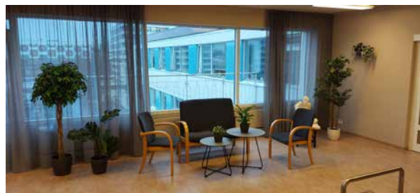
Stigagangur 5. hæð.

Fjórða hæðin í b-álmunni hefur staðið auð síðan um mitt ár 2018 en hæðin hafði áður verið í notkun hjá Sjálfsbjargarheimilinu frá upphafi eða í 45 ár. Hér er um 500 fermetra nokkuð sérhæft húsnæði að ræða og hefur það verið auglýst til útleigu reglulega, en ekki hefur tekist að leigja það út.