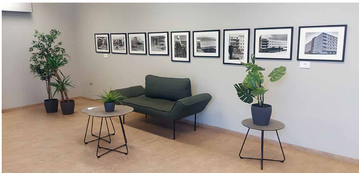
Stigagangur 1. hæð.

Viðhald. Á hverju ári eru ávallt margvísleg viðhaldsverkefni í gangi.