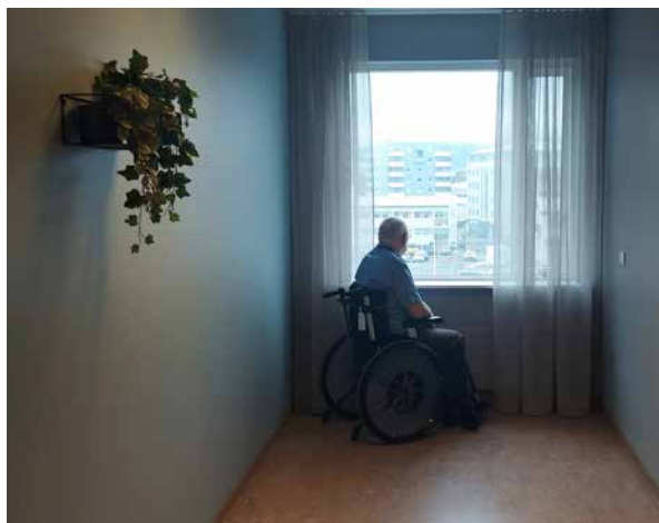
Íbúagangur 3. hæð.

Möguleikar á að breyta rýminu í íbúðir verða skoðaðir á næsta ári.